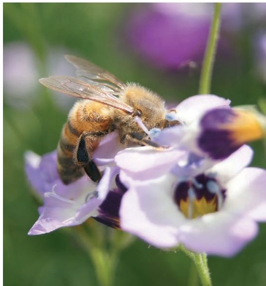
Bien og blomsten hører sammen.

De fleste biavlere fjerner alt honningen fra bierne sidst på sommeren og fodrer dem derefter med sukker. Mange biavlere mener endda, at det ligefrem er sundere for bierne. Sukkeret er helt rent, og derfor mener de, at det er bedre for bierne, så man fx undgår diarre hos bierne. I Danmark er det endda forbudt at fodre bierne med honning! Honning er generelt betegnet som sundt, når det skal sælges til mennesker, men bierne - påstår de sjovt nok - har bedst af sukker! Nu er der dog kommet forsøg, som viser det man kunne forvente, nemlig at for bierne er honning også sundt, idet det styrker deres immunforsvar i forhold til sukker. En amerikansk undersøgelse viser, at honningen aktiverer enzymer, som bliver brugt til at nedbryde fremmedstoffer som fx pesticider. Sukker aktiverer ikke disse stoffer. Bierne er desuden stærkt påvirket af det de spiser. Det er bl.a. med til at påvirke dem til på et tidligt stadie om de bliver til en arbejderbi, drone eller dronning. Biernes ernæring påvirker dem altså helt ind i det fysiske.